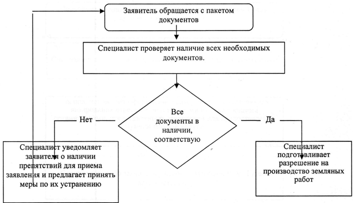
Блок-схема последовательности при приеме документов